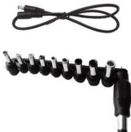
Καλώδιο DC 10 βύσματα για σύνδεση με laptop