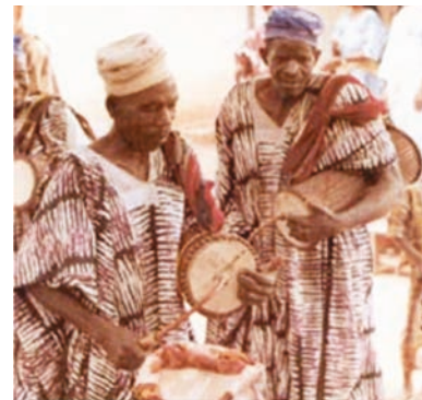
Μουσικοί της φυλής Γιορούμπα