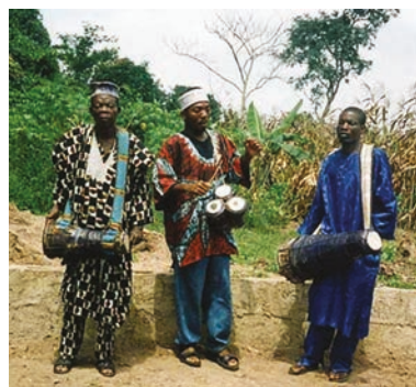
Μουσικοί από τη Δ. Αφρική

Κατά την εκτέλεση, ένας μουσικός μπορεί να αυτοσχεδιάζει ή να φτιάχνει μια ιδιαίτερη παραλληλαγή της μελωδίας, ενώ οι άλλοι τραγουδιστές συνεχίζουν την αρχική μελωδία.