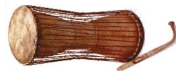
Τύμπανο που μιλά