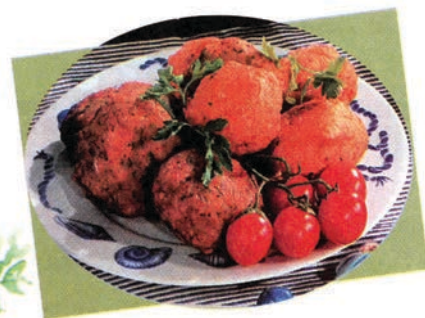
περ. Μενού & άλλα, τεύχ. 44, Μάρτιος-Απρίλιος 2002

http://www.mfa.gr/greek/greece/living/cuisine/