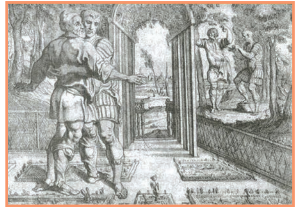
Θ. Βαν Θούλντεν, Ο Οδυσσέας απακαλύπτεται στον Λαέρτη , χαρακτηριστικό, Μουσείο Καλών Τεχνών, Σαν Φρανσίσκο (Ομήρου Οδύσσεια , ΟΕΔΒ, 2001)

Έφτασα λοιπόν στα χωράφια του Λαέρτη και κάθισα να ξεκουραστώ και να διαβάσω τη ραψωδία ω της Οδύσσειας. Ο ερχομός ενός ξένου είναι γεγονός ακόμα και στην πρωτεύουσα της Ιθάκης. Πόσο μάλλον στην ύπαιθρο! Μόλις κάθισα, οι χωρικοί μαζεύτηκαν γύρω μου κι άρχισαν να με βομβαρδίζουν με ερωτήσεις. Σκέφτηκα πως το καλύτερο που είχα να κάνω ήταν να διαβάσω μεγαλόφωνα τους στίχους 205 ως 412 της ραψωδίας ω και να τους μεταφράζω λέξη προς λέξη στη γλώσσα τους. Η ανάγνωση τους συγκίνησε πολύ κι άκουγαν με προσοχή τη μουσική γλώσσα του Ομήρου, τη γλώσσα των ένδοξων προγόνων τους, που έζησαν πριν από τρεις χιλιάδες χρόνια. Προχωρούσαμε στα χωράφια κι εγώ τους διάβαζα για τα τρομερά βάσανα που είχε περάσει ο βασιλιάς Λαέρτης σε κάθε σημείο της περιοχής εκείνης, καθώς και για τη μεγάλη του χαρά όταν ξαναβρήκε, έπειτα από είκοσι χρόνια χωρισμού, τον αγαπημένο του γιο, τον Οδυσσέα, που τον είχε για νεκρό. Τα μάτια όλων είχαν δακρύσει, κι όταν τελείωσα την ανάγνωση, άντρες, γυναίκες και παιδιά με πλησίασαν, με αγκάλιασαν και μου είπαν: «Μας έδωσες μεγάλη χαρά, σ' ευχαριστούμε χίλιες φορές». Με συνόδεψαν θριαμβευτικά μέχρι την πόλη, όπου ήθελαν να με φιλοξενήσουν με κάθε γενναιοδωρία και χωρίς κανείς να ενοχληθεί στο ελάχιστο. Δε μ' άφησαν να φύγω πριν να υποσχεθώ πως θα ξαναεπισκεφτώ το χωριό τους.