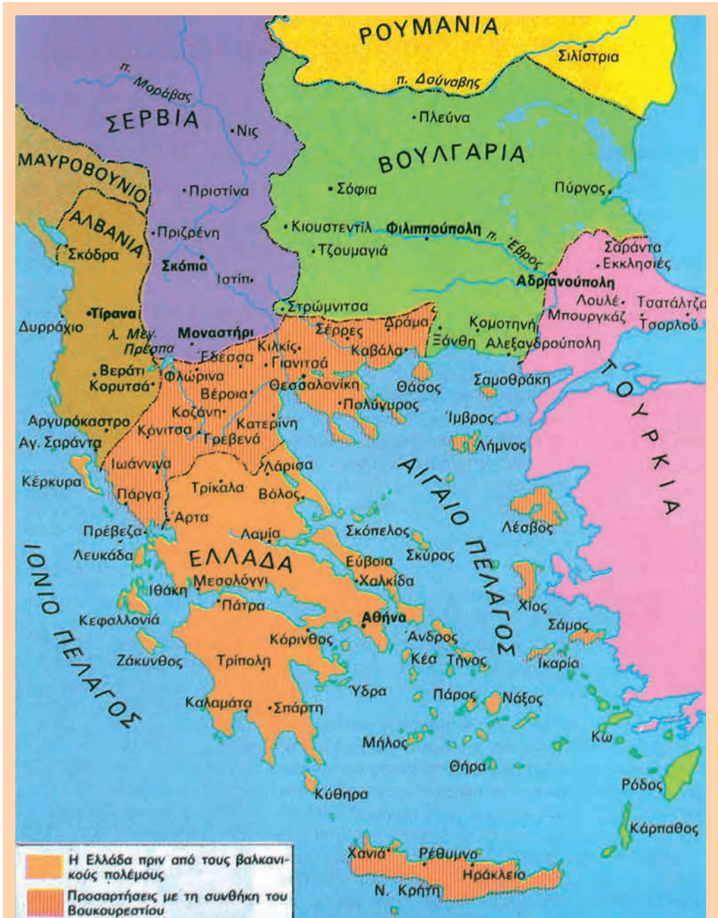
Χάρτης της Ελλάδας με τις αλλαγές στα σύνορα από το 1881 μέχρι το 1913