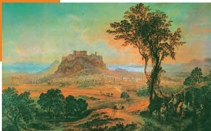
Πανόραμα της Αθήνας στα 1830-1840

οποία οι αγρότες πάσχιζαν να βελτιώσουν τις αποδόσεις τους. Τα περιφραγμένα περιβόλια πολύ λίγο βελτίωναν την αίσθηση εγκατάλειψης που απέπνεε το τοπίο.