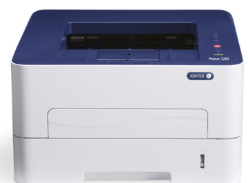
Phaser 3260. Εκτύπωση.