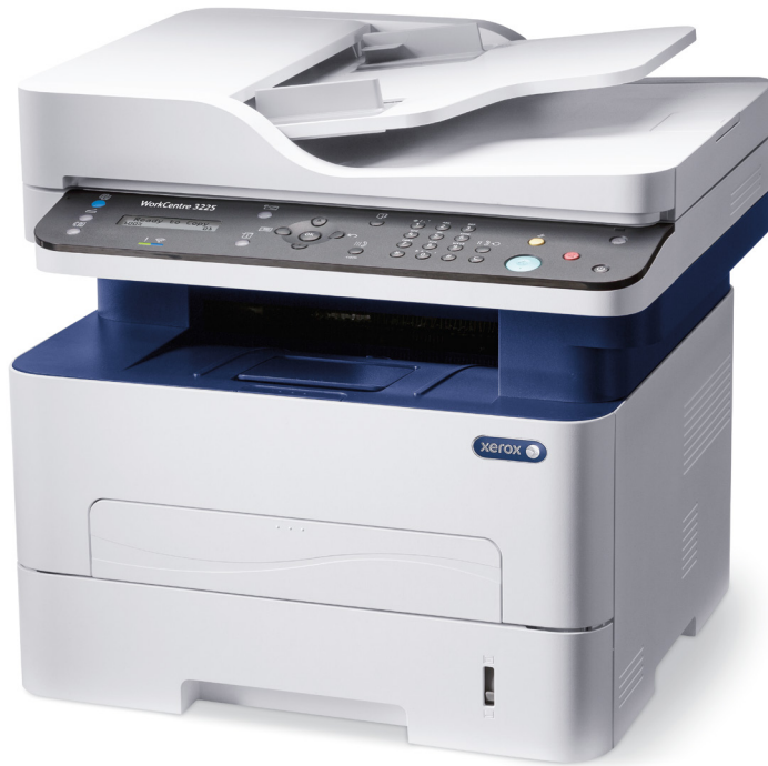
WorkCentre 3225. Αντιγραφή. Εκτύπωση. Σάρωση. Φαξ. Email.