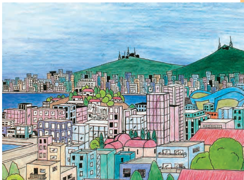
Εικόνα: Χρήστος Η. Παπαδημητρίου

Τι ζωή φριχτή είν' αυτή στη μεγάλη πόλη μες στη σκόνη, στον καπνό και δουλειά και σκόλη! Χάρης Σακελλαρίου