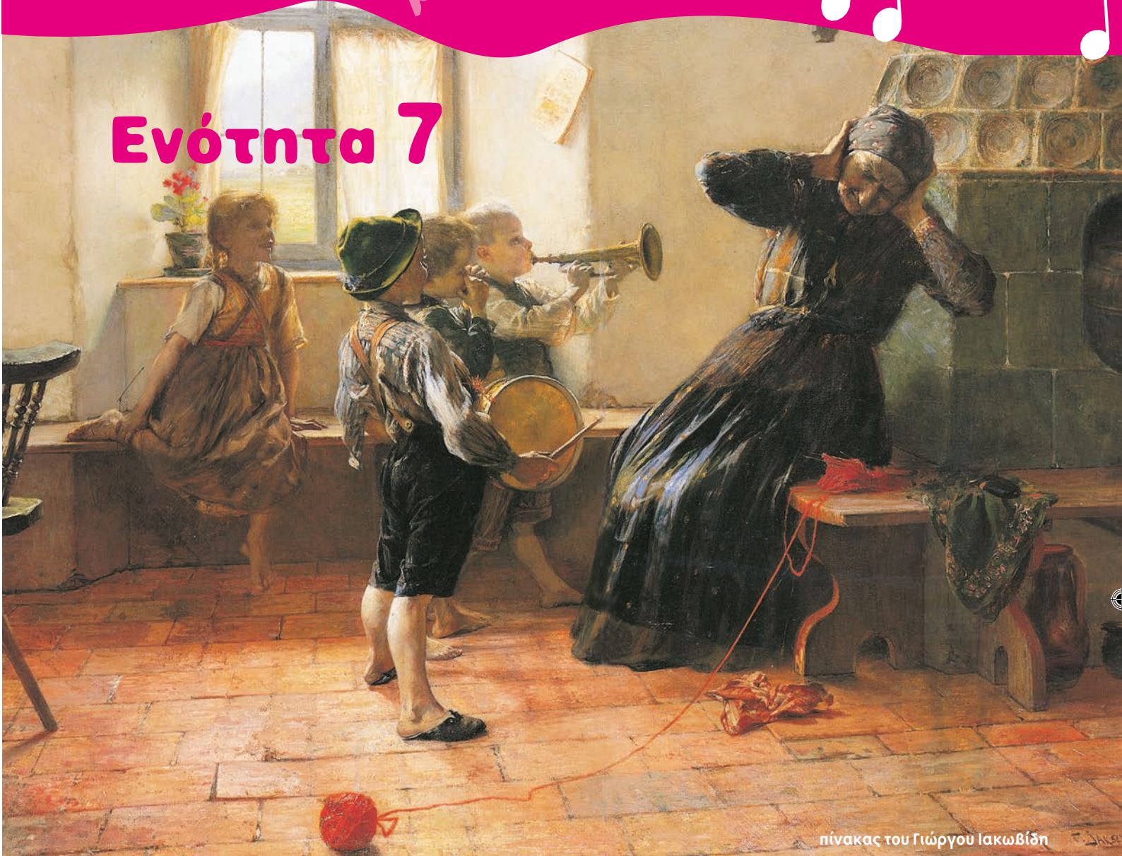
πίνακας του Γιώργου Ιακωβίδη