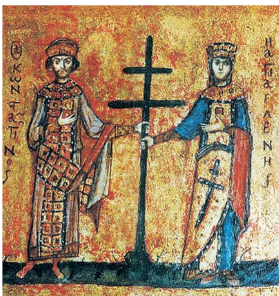
Οι άγιοι Κωνσταντίνος και Ελένη

«Ο Κωνσταντίνος έστειλε τη μητέρα του Ελένη στα Ιεροσόλυμα να αναζητήσει τον σταυρό, πάνω στον οποίο σταυρώθηκε ο Χριστός. Κι εκεί, με θαυματουργή βοήθεια που σπάνια σήμερα την αξιώνονται οι αρχαιολόγοι, βρήκε τον Γολγοθά. Έβγαλε από τη Γη τον ίδιο τον τίμο σταυρό, τους σταυρούς των (δύο) ληστών, τη λόγχη, τον ακάνθινο στέφανο και όλα τα λείψανα τα σχετικά με τα θεία πάθη. Στο σημείο αυτό έχτισε τον ναό της Αναστάσεως του Χριστού που σώζεται έως σήμερα. Το γεγονός αυτό έκαμε τη χριστιανοσύνη να σκιρτήσει και της έδωσε αιώνια δόξα. Τα ονόματα του Κωνσταντίνου και της Ελένης έγιναν, κι έμειναν, τα πιο σεβαστά στην ιστορία της αυτοκρατορίας».