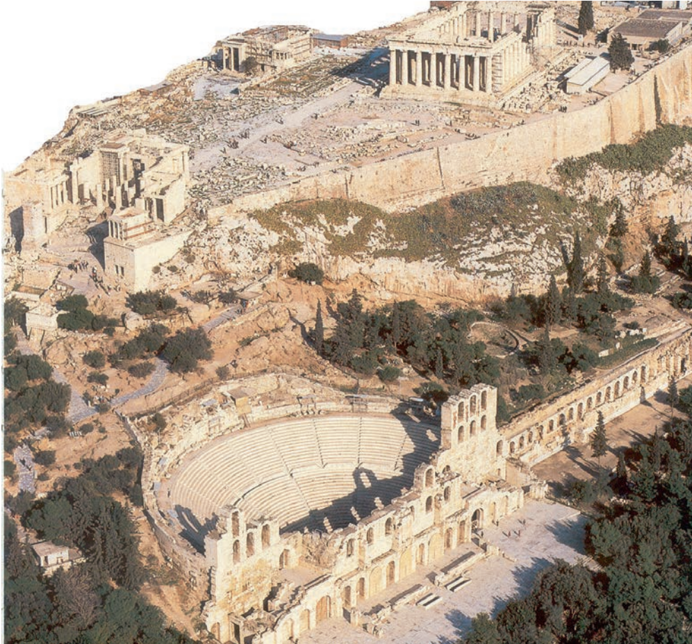
Το ρωμαϊκό Ωδείο Ηρώδη του Αττικού, κάτω από την Ακρόπολη