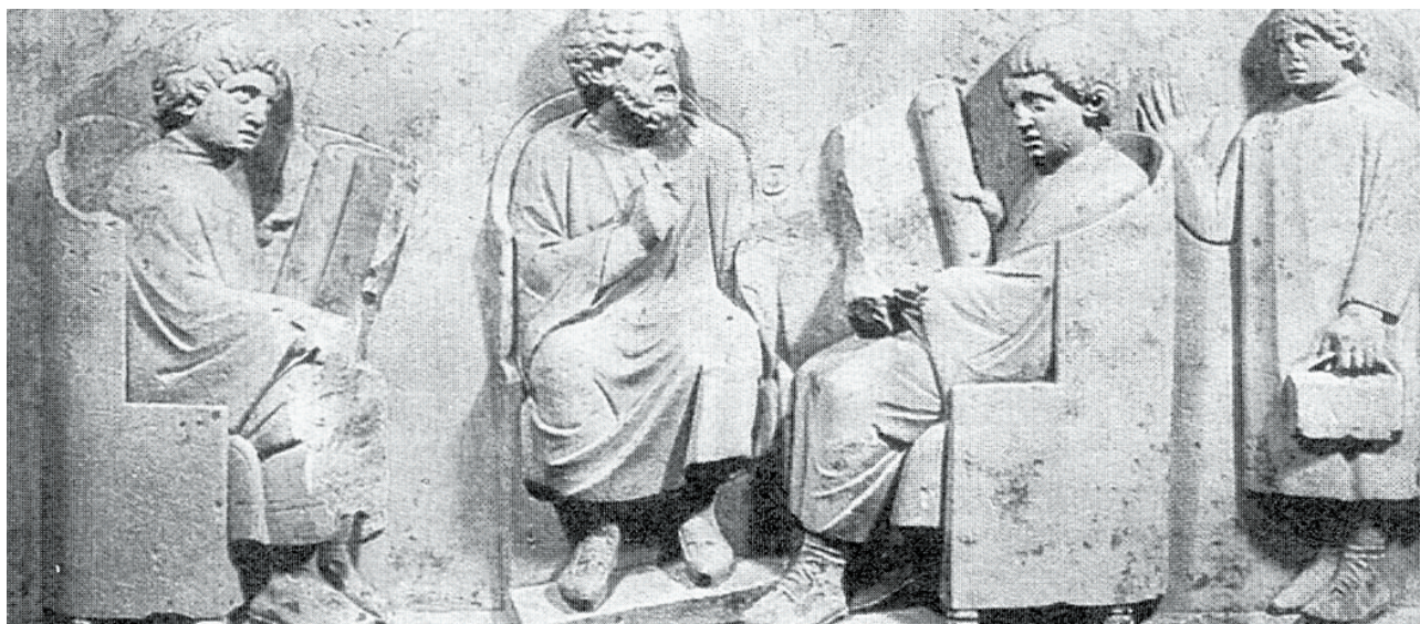
Δάσκαλος και μαθητές σε ώρα μαθήματος. ( Ανάγλυφο, Trier, Μουσείο Ρήνου )

Τα Ρωμαϊόπουλα μάθαιναν γράμματα από δασκάλους δούλους των οικογενειών τους ή από ελεύθερους που είχαν δικά τους σχολεία. Διδάσκονταν ανάγνωση, γραφή, γραμματική, αριθμητική, ιστορία και υπακοή. Οι μαθητές υπάκουαν στις συμβουλές ή τις εντολές των δασκάλων τους τόσο, ώστε «οι λέξεις μαθητής και πειθαρχία ήταν σχεδόν συνώνυμες».