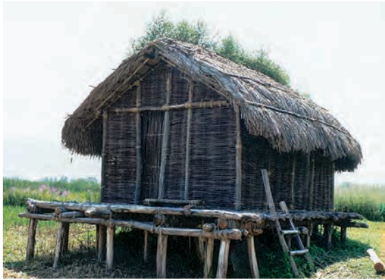
Το Διψηλιό, όπως εμφανίζεται σήμερα, με αναπαράσταση μιας λιμναίας καλύβας (5.200 π.Χ.)