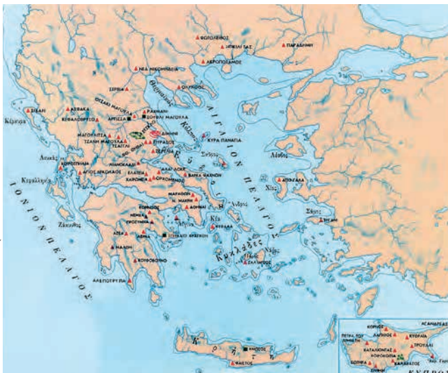
Η νεολιθική Ελλάδα. Στον χάρτη αναφέρονται όλοι οι νεολιθικοί οικισμοί που έχουν ανασκαφεί. Σε ποια ελληνική περιοχή παρατηρείται η μεγαλύτερη πυκνότητα και πώς τη δικαιολογείς;