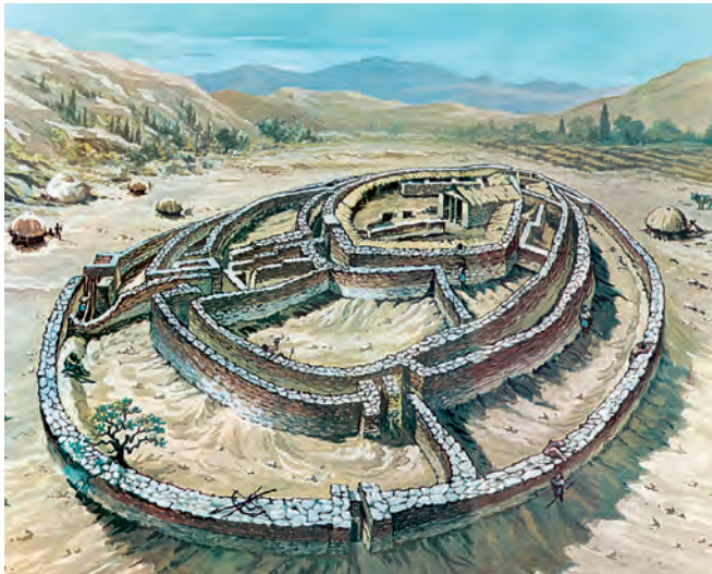
Ένας νεολιθικός οικισμός στην Ελλάδα: Διμήνη. Αναπαράσταση της νεολιθικής ακρόπολης στο Διμήνη, στην περιοχή του Βόλου.