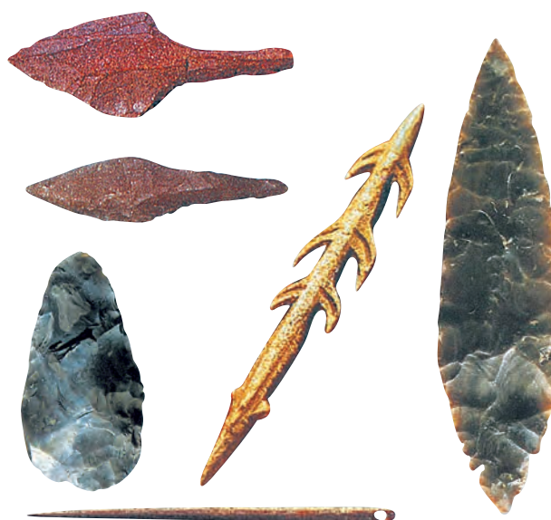
Τα κύρια εργαλεία του ανθρώπου της Παλαιολιθικής εποχής (Μουσείο Βόλου)

Στον ελλαδικό χώρο η παρουσία του παλαιολιθικού ανθρώπου πιστοποιείται σε περιοχές