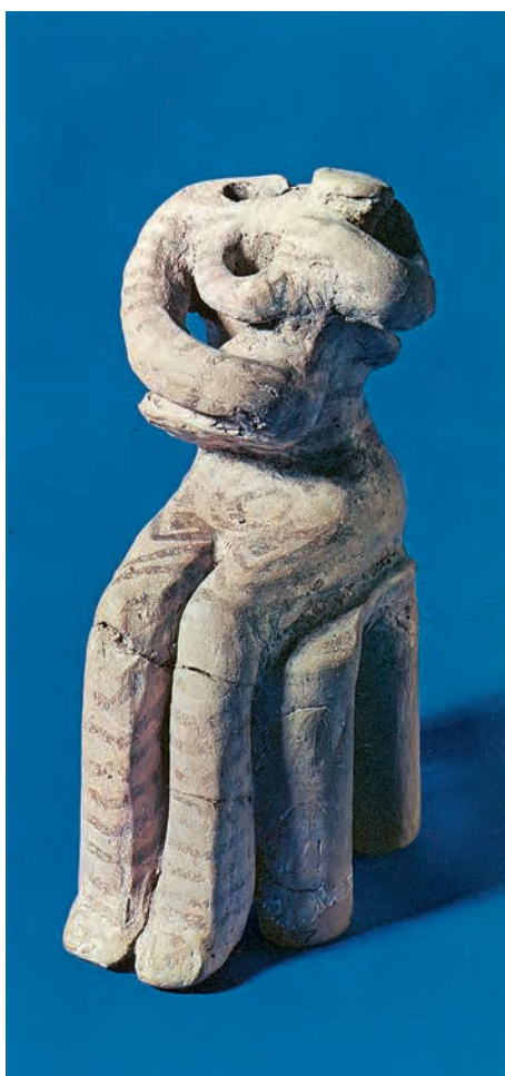
Πήλινο ειδώλιο Κουροτρόφου* από τη Θεσσαλία. Λέπει το κεφάλι. Η γυναίκα κάθεται σε σκαμνί και κρατάει στην αγκαλιά της βρέφος. Όλη η μορφή είναι διακοσμημένη με απλές γραμμές και σπείρες. (Μουσείο Βόλου)

Δε γνωρίζουμε αν οι άνθρωποι είχαν ατομική ιδιοκτησία της γης. Το πιο πιθανό είναι ότι η γη ανήκε συλλογικά στην κοινότητα. Τα νεολιθικά κοπάδια, από οικίσκισα ζώα, πρέπει να ήταν μικρά. Την ευθύνη για τη βοσκή τους μπορεί να την είχε ολόκληρη η κοινότητα.