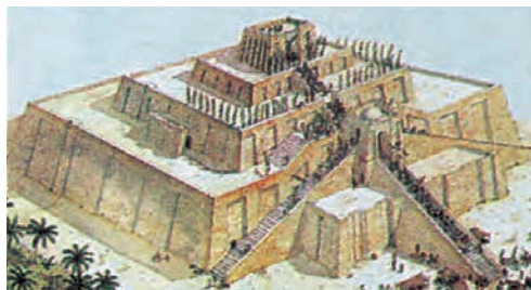
Ναός και αστεροσκοπείο μαζί. Αναπαράσταση ενός ναού-αστεροσκοπείου, ενός Ζιγκουράτ, από την πόλη Ουρ. Οι επάλληλες τραπεζοειδείς κατασκευές καταλήγουν σε ένα μικρό πυργοειδές οικοδόμημα, το οποίο χρησίμευε ως ναός και παρατηρητήριο συγχρόνως.