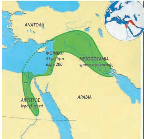
Η «Εύφορη ημισέληνος».

Η μετάβαση του ανθρώπου από την Παλαιολιθική εποχή της κυνηγετικής και τροφосуλλεκτικής οικονομίας στη Νεολιθική, όταν ο άνθρωπος γίνεται γεωργός και κτηνοτρόφος , αποτελεί μία πραγματική επαναστατική αλλαγή. Η Νεολιθική εποχή χαρακτηρίζεται από τα παρακάτω στοιχεία, που το ένα αποτελεί συνέχεια του άλλου: α) μόνιμη εγκατάσταση του ανθρώπου και δημιουργία οικισμών β) απασχόληση με τη γεωργία και την κτηνοτροφία και γ) χρήση της κεραμικής.