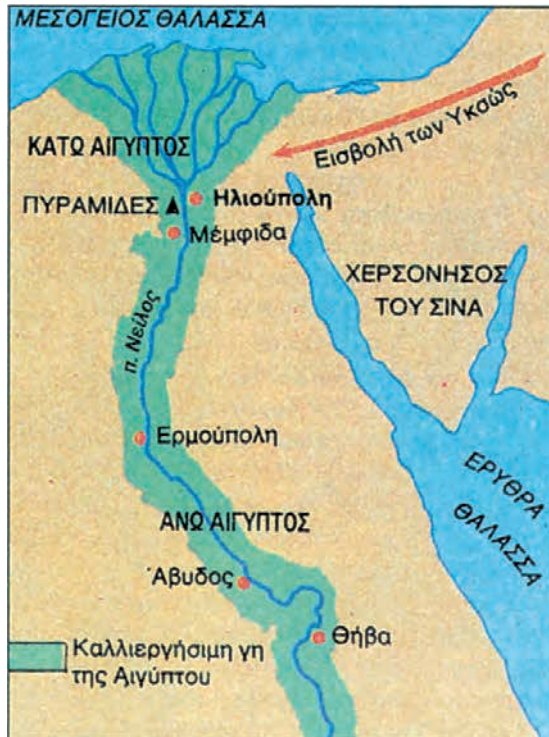
Χάρτης της αρχαίας Αιγύπτου.

απόλυτα τις ανάγκες των Αιγυπτίων. Στο δέλτα του ποταμού ψαρεύουν και το κυνήγι είναι άφθονο. Εκεί φυτρώνει σε αφθονία ο πάπυρος* , τον οποίο χρησιμοποιούν για να κατασκευάζουν πλοία, καλάθια, σχοινιά και, κυρίως, ένα είδος χαρτιού.