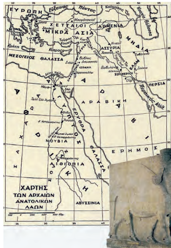
Χάρτης της ανατολικής λεκάνης της Μεσογείου. Μελέτησε τον χάρτη και εξήγησε την προνομιακή θέση της Ελλάδας στους θαλάσσιους δρόμους.

« Η στήλη του Χαμουραμπί ». (Παρίσι, Μουσείο Λούβρου). Στη στήλη εικονίζεται ο Χαμουραμπί, όρθιος αριστερά, να δέχεται τη νομοθεσία από τον θεό Σαμάς. Στο κάτω μέρος της στήλης είναι γραμμένη, σε σφηνοειδή γραφή, η νομοθεσία του Βαβυλώνιου βασιλιά.