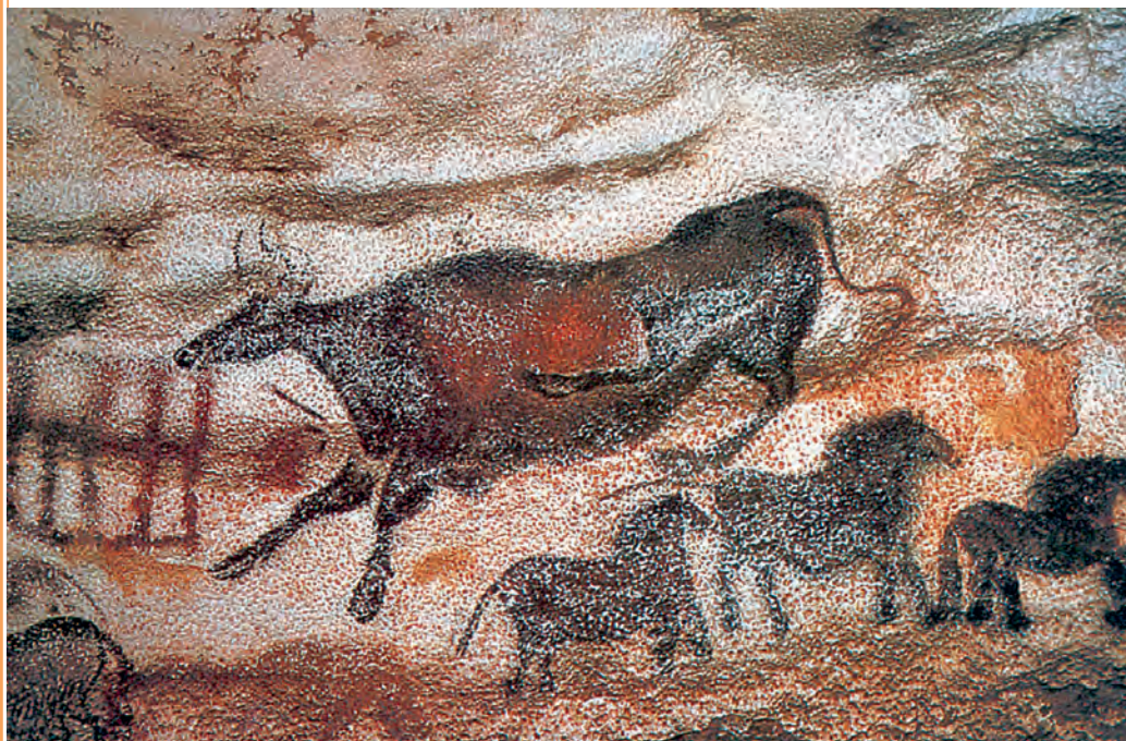
Σπηλαιογραφία από τα σπήλαια της Νίαυκ (Γαλλία)

Κοσμάς Τουλούμης, Πριν από την Ιστορία , σ. 40