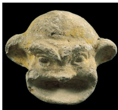
Γύψινο κωμικό προσωπεῖο των ἐλληνιστικῶν χρόνων ἀπό την Αίγυπτο. (Αθήνα, Μουσείο Μπενάκη.)

ΤΟ ΑΠΟΣΠΑΣΜΑ Σ' αὐτό τον επικύ τύπου κατάλογο, που διανθίζεται με ἐπίκαιρες κωμικές αιχμές για ἐχθρούς των Αθηναίων, αναφέρονται τα χαρακτηριστικά προϊόντα κάθε πόλης ἢ περιούχης (Τὰ ἐξ ἐκάστης πόλεως ἰδιώματα), που εισάγονται δια θαλάσσης στην Αθήνα. Ἐνα χωρίο ἀπό την Αθηναίων πολιτεία του Ψευδο-Ξενοφῶντα, που γράφει περίπου την ἴδια ἐποχή, και ἕνα ἄλλο ἀπό τον Θουκυδίδειο ἐπιτάφιο του Περικλή, που ἐκφωνήθηκε το 430 π.Χ., δείχνουν ὅτι η εικόνα που δίνει ο κωμικός δεν ἀπέχει πολύ ἀπό την πραγματικότητα. (Ψευδο-Ξενοφῶν, Αθηναίων πολιτεία 2,7 χάρη στην κυριαρχία στη θάλασσα... καθώς ἔρχονταν σε ἐπαφή με ἄλλους στο ἕνα μέρος με ἄλλους στο ἄλλο, διδάχθηκαν τρόπους γαστρονομικῶν ἀπολαύσεων. Ὅτι καλὸ ὑπάρχει στη Σικελία ἢ στην Ἰταλία ἢ στην Κύπρο ἢ στην Αίγυπτο ἢ στη Λυδία ἢ στον Πόντο ἢ στην Πελοπόννησο ἢ κάπου αλλοῦ, ὅλα αὐτά τα βρίσκεις συγκεντρωμένα στο ἴδιο σημεῖο χάρη στην κυριαρχία στη θάλασσα. – Θουκυδίδης 2, 38, 2 ἐπιπλέον, χάρη στη δύναμη της πόλης, φτάνουν ἐδῶ ἀπό παντοῦ τα πάντα. Ἐτσι συμβαίνει να ἀπολαμβάνουμε τα ἀγαθὰ των ἄλλων με τον ἴδιο τρόπο που ἀπολαμβάνουμε και τα δικά μας.)