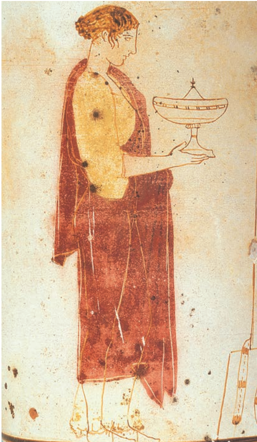
Νεαρή γυναίκα με προσφορές για τον νεκρό άντρα της (βλ. σελ. 11). Λευκή λήκυθος, περ. 445-440 π.Χ. (Αθήνα, Εθνικό Αρχαιολογικό Μουσείο.)

Το τι σημαίνουν συγκεκριμένα όλα αυτά το αντιλαμβάνεται κανείς ευκολότερα, αν επιχειρήσει να σκεφτεί ποιους θα συναντούσε ένας που θα ζούσε στην Αθήνα, για παράδειγμα, τη δύσκολη πενταετία 430-425 π.Χ. (Πελοποννη-