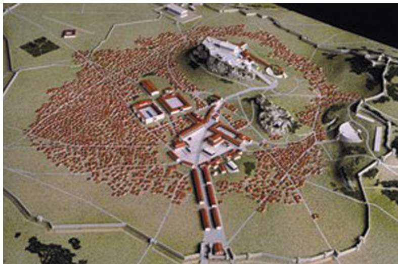
Η Ακρόπολη και ο χώρος γύρω από αυτή. (Μακέτα των Ι. Τραυλού-Δ. Ζιρώ.)