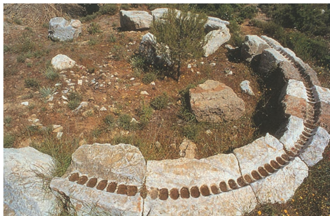
Ελικοειδές πλυντήριο του 4ου αι. π.Χ. για τον καθαρισμό του μεταλλεύματος (Λαύριο).