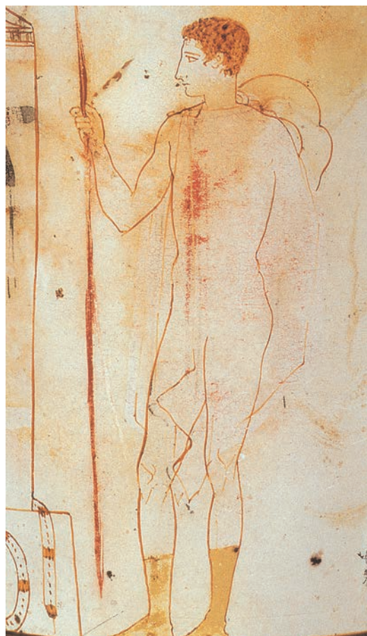
Βλ. τη λεζάντα στη σελ. 10

Αν ένας Αθηναίος δεν απουσίαζε σε κάποια από τις πολλές πολεμικές επιχειρήσεις, που αποτελούσαν καθημερινή πραγματικότητα, και δεν εργαζόταν, το πιθανότερο είναι να έκανε ένα από τα ακόλουθα: (α) Να έπαιρνε μέρος σε συνεδρίαση της Εκκλησίας του Δήμου, της βουλής ή κάποιου δικαστηρίου –η δικομανία των Αθηναίων δεν είχε προηγούμενο, ενώ οι συνεδριάσεις της Εκκλησίας του Δήμου έφταναν τις 40 τον χρόνο· (β) να συμμετείχε σε συμπόσιο ή σε γιορτή –ένας επικριτής της αθηναϊκής δημοκρατίας ισχυρίζεται ότι οι Αθηναίοι είχαν διπλάσιες γιορτές από ότι οι άλλοι Έλληνες· (γ) να συζητούσε στην παλαίστρα, σε κάποια στοά, σε κάποιο κουρείο ή οπουδήποτε αλλού –οι Αθηναίοι είχαν τη φήμη ότι ήταν πιο πολύ άνθρωποι των λόγων παρά των έργων, ήταν, όπως τους λέει ο Κλέων, «θεατές των λόγων και ακροατές των έργων».