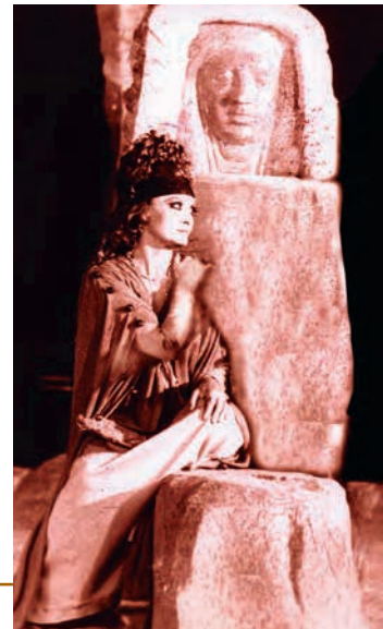
Ελένη (Α. Λαδικού, Κ.Θ.Β.Ε., 1982, σκην. Α. Βουτσαϊνός)