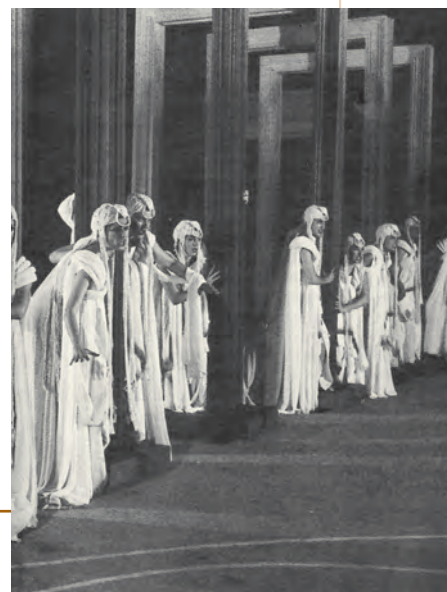
Σκηνοτικό με κάτοπτρα για παράσταση της Ελένης (Αμφιθέατρο, 1999)