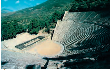
Πριν από την παράσταση