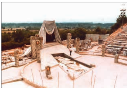
Σκηνοτικό για παράσταση της Ελένης (Κ.Θ.Β.Ε., 1982, σκηνογρ. Δ. Φωτόπουλος)