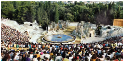
Η παράσταση αρχίζει

Η παράσταση αρχίζει... Οι Αθηναίοι έχουν ανηφορίσει στο θέατρο του Διονύσου, για να παρακολουθήσουν την Ελένη του Ευριπίδη. Περιμένουν γεμάτοι προσοχή. Η φήμη που απλώθηκε στην πόλη από όλους όσοι παρακολούθησαν τον προάγωνα* είναι πως θα βρεθούν μπροστά σε μια διαφορετική Ελένη.