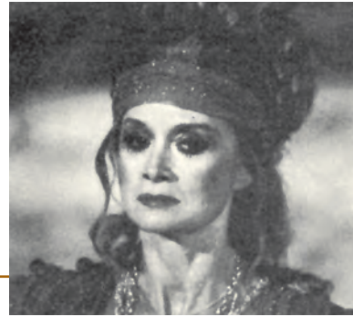
Ελένη (Α. Λαδικού, Κ.Θ.Β.Ε., 1982, σκην. Α. Βουτσαϊνός)