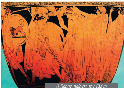
Ο Πάρις παίρνει την Ελένη. Ανάμεσά τους ο Έρωτας (ερυθρόμορφο αγγείο του 5ου αι. π.Χ.)

1. Αλάστορας: δαίμονας της εκδίκησης, εκδικητής