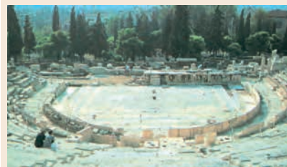
Το θέατρο του Διονύσου

Από την τριλογία του Ευριπίδη, που παρουσιάστηκε στα Διονύσια την άνοιξη του 412 π.Χ., μόνο η Ελένη σώθηκε. Πώς να κρίθηκε άραγε;