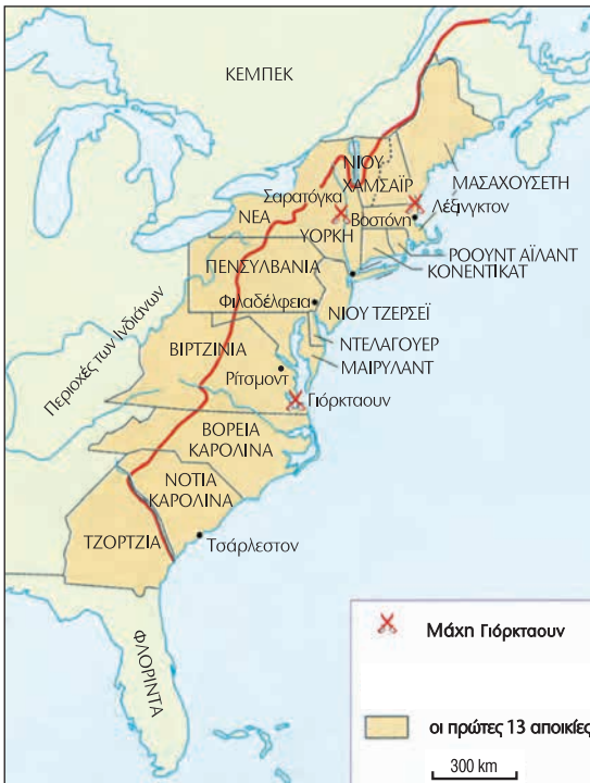
1. Οι 13 αγγλικές αποικίες στην Αμερική και η αμερικανική επανάσταση.

Οι αγγλικές αποικίες στην Αμερική Κατά την περίοδο 1607-1732 δημιουργήθηκαν στα ανατολικά παράλια της Βόρειας Αμερικής 13 αποικίες υπό αγγλικό έλεγχο. Οι άποικοι ήταν κυρίως Άγγλοι, αλλά και Γάλλοι, Γερμανοί και Σουηδοί. Τεχνίτες και κατεστραμμένοι μικροεπιχειρηματίες, θύματα θρησκευτικών διώξεων αλλά και κατάδικοι, όλοι αναζητούσαν μια καλύτερη τύχη.