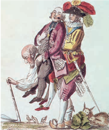
1. Γελοιογραφία που απεικονίζει την τρίτη τάξη να κουβαλά τον κλήρο και την αριστοκρατία.

Η γαλλική κοινωνία του 18ου αιώνα ήταν οργανωμένη σε τρεις θεσμοθετημένες τάξεις (οι άνθρωποι κατατάσσονταν σε αυτές με κριτήριο την καταγωγή τους και τα προνόμια που τους είχαν απονεμηθεί από τον ηγεμόνα): τον κλήρο (0,5% του πληθυσμού), τους ευγενείς (1,5% του πληθυσμού) και την τρίτη τάξη (98% του πληθυσμού), που την αποτελούσαν όλοι όσοι δεν ανήκαν στις δύο προηγούμενες τάξεις, δηλαδή οι αστοί, οι αγρότες και οι εργάτες. Ο κλήρος και οι ευγενείς είχαν προνόμια, ενώ η τρίτη τάξη είχε μόνο υποχρεώσεις (πλήρωνε το σύνολο των φόρων, τη στιγμή που οι άλλες τάξεις δεν φορολογούνταν). Η κατάσταση αυτή, το παλαιό καθεστώς , γεννούσε τη δυσαρέσκεια, ιδίως της αστικής τάξης (του ανώτερου στρώματος της τρίτης τάξης), η οποία, αν και δέσποζε στην οικονομία, ήταν αποκλεισμένη από τη λήψη των πολιτικών αποφάσεων. Παράλληλα, η δυσφορία εξαπλωνόταν στο σύνολο της τρίτης τάξης, καθώς, από τα μέσα του 18ου αιώνα, οι συνθήκες ζωής επιδεινώνονταν διαρκώς. Μάλιστα, κατά τον φοβερό χειμώνα του 1788-1789, η πείνα οδήγησε τον λαό σε λεηλασίες πλούσιων σπιτιών και κρατικών αποθηκών.