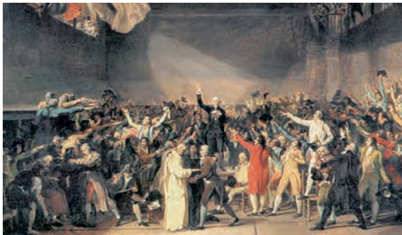
2. Ζ.Λ. Νταβίντ, Ο όρκος του σφαιριστηρίου, 20 Ιουνίου 1789.

Η κατάσταση αυτή έκανε τον βασιλιά Λουδοβίκο ΙΣΤ΄ να συγκαλέσει συνέλευση των τάξεων στο ανάκτορο των Βερσαλιών (5 Μαΐου 1789). Εκεί, οι αντιπρόσωποι της τρίτης τάξης απαίτησαν μεταρρυθμίσεις, αλλά ο βασιλιάς ζήτησε να επιβληθούν νέοι φόροι που θα πλήρωναν αποκλειστικά τα μέλη της τρίτης τάξης.