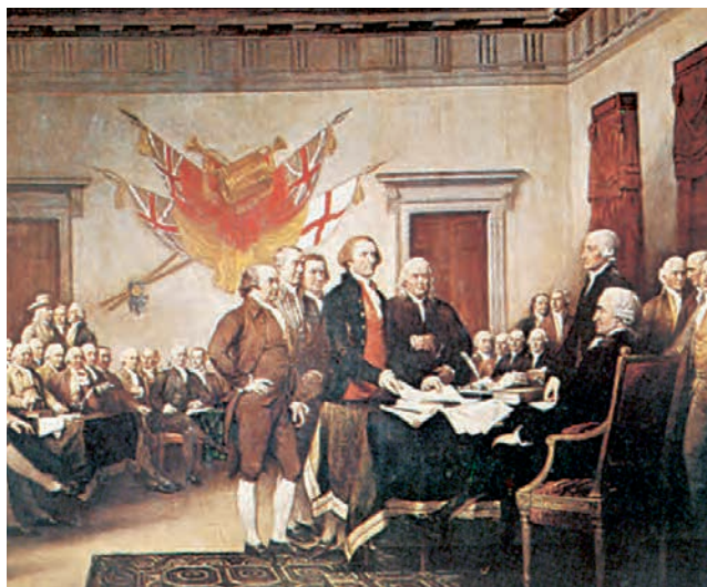
3. Τζ. Τράμπουλ, Η υπογραφή της αμερικανικής Διακήρυξης της Ανεξαρτησίας, 4 Ιουλίου 1776. Η 4η Ιουλίου αποτελεί εθνική γιορτή των ΗΠΑ.

Ο πόλεμος που ακολούθησε έμεινε γνωστός ως αμερικανική επανάσταση ή πόλεμος της ανεξαρτησίας . Αρχικά, οι Αμερικανοί, με αρχιστράτηγο τον Τζορτζ Ουάσινγκτον, αντιμετώπισαν προβλήματα. Μετά το 1778, όμως, εκμεταλλευόμενοι