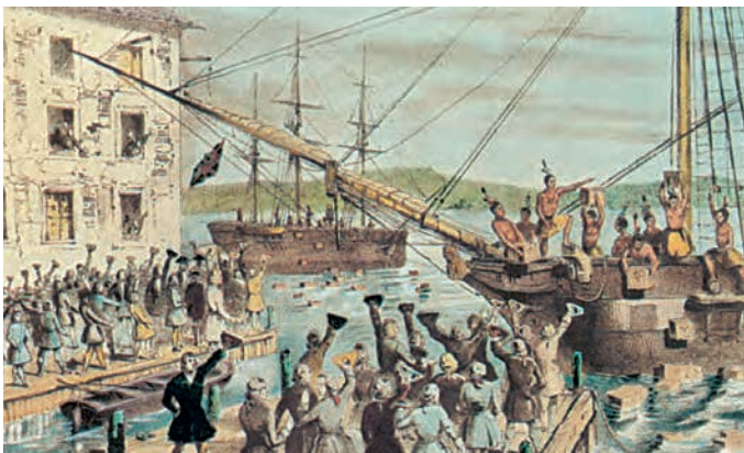
2. Η «γιορτή του τσαγιού»: Αμερικανοί πετούν στη θάλασσα αγγλικό τσάι στο λιμάνι της Βοστώνης, αντιδρώντας στην επιμονή της Αγγλίας να συνεχίσουν να πληρώνουν φόρους γι' αυτό το προϊόν.

Μετά τον Επταετή πόλεμο (βλέπε γλωσσάριο) των ετών 1756-1763, η Αγγλία όχι μόνο απαγόρευσε στους Αμερικανούς να εκμεταλλευτούν τον Καναδά και τη Φλόριντα, που μόλις είχε καταλάβει, αλλά και απαίτησε από αυτούς νέους φόρους για να καλύψει ένα μέρος των πολεμικών δαπανών.