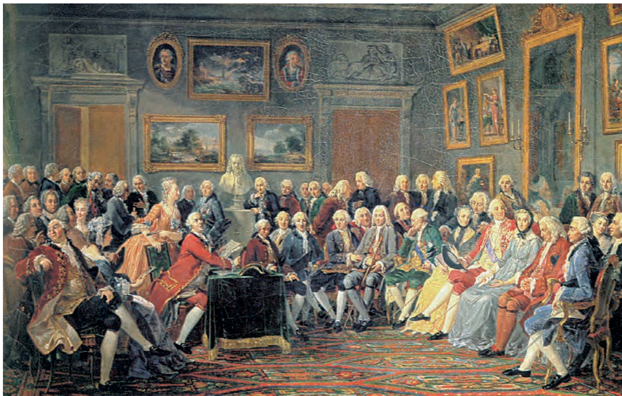
4. Γκ. Λεονιέ, Ο Ντ' Αλαμπέρ (στο τραπέζι) διαβάζει την Εγκυκλοπαίδεια στο σαλόνι της μαντάμ Ζοφρέν: τα παρισινά σαλόνια υπήρξαν εστίες του Διαφωτισμού.

οικονομικό φιλελευθερισμό, που υποστήριζε ότι το κράτος δεν πρέπει να επεμβαίνει παρά ελάχιστα στην οικονομική ζωή. Εισηγητής του υπήρξε ο Άνταμ Σμιθ με το έργο του Έρευνες για τη φύση και τα αίτια του πλούτου των εθνών (1776).