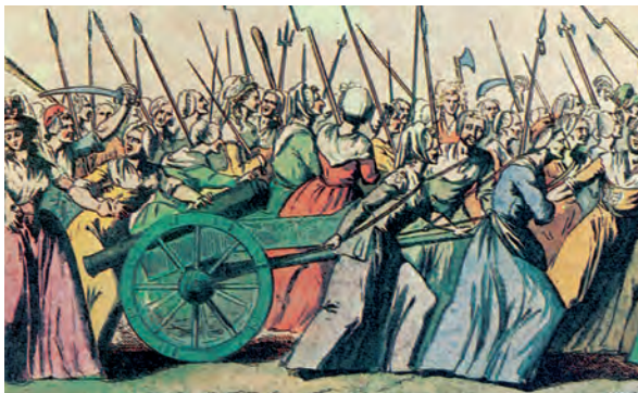
3. Οπλισμένες γυναίκες βαδίζουν εναντίον των ανακτόρων των Βερσαλιών, 5 Οκτωβρίου 1789.

Οι αντιπρόσωποι της τρίτης τάξης αντέδρασαν και, με το επιχείρημα ότι εκπροσωπούσαν το 98% των Γάλλων, αυτοανακηρύχθηκαν Εθνική συνέλευση. Ο βασιλιάς, ωστόσο, δεν τους αναγνώρισε και διέταξε να κλείσει η αίθουσα όπου συνεδρίαζαν οι τάξεις. Τότε, οι αντιπρόσωποι της τρίτης τάξης συγκεντρώθηκαν στην αίθουσα του σφαιριστηρίου (βλέπε δίπλα, εικόνα 2), όπου ορκίστηκαν ότι θα συντάξουν σύνταγμα (20 Ιουνίου 1789). Στο πλευρό τους τάχθηκαν ορισμένοι κληρικοί και ευγενείς. Ο βασιλιάς αναγκάστηκε να υποχωρήσει. Η Εθνοσυνέλευση αυτοανακηρύχθηκε Συντακτική συνέλευση (9 Ιουλίου 1789), με σκοπό να δώσει στη Γαλλία σύνταγμα.