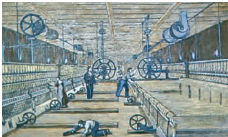
1. Εργοστάσιο υφαντουργίας στην Αγγλία (περίπου 1750).

Έτσι, από τη μια πλευρά υπήρχαν επιχειρηματίες που διέθεταν κεφάλαια. Από την άλλη πλευρά, υπήρχαν χιλιάδες πρώην αγρότες, οι οποίοι, λόγω των μεταβολών που συνέβαιναν στην αγροτική οικονομία, είχαν μείνει δίχως εργασία και είχαν καταφύγει στις πόλεις αναζητώντας κάποιο εισόδημα. Οι δύο αυτοί παράγοντες οδήγησαν, χάρη και στην καταλυτική παρουσία ισχυρών μηχανών, στη δημιουργία μεγάλων εργοστασίων, δηλ. στη γέννηση της βιομηχανίας, την εκβιομηχάνιση. Οι μεταβολές αυτές, που άρχισαν να συντελούνται στη Μ. Βρετανία γύρω στα 1750-1780, αποτέλεσαν την πρώτη φάση του φαινομένου που ονομάστηκε βιομηχανική επανάσταση .