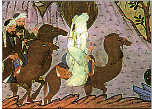
Η επιστροφή του Μωάμεθ στη Μέκκα (μικρογραφία από αραβικό χειρόγραφο). Το λευκό χρώμα οφείλεται στην απαγόρευση της απεικόνισης ιερών προσώπων.

νους ιδιαίτερη σημασία είχε ο ιερός πόλεμος (τζιχάντ), δηλαδή η υποχρέωση των πιστών να διαδώσουν με το σπαθί τη θρησκεία τους στους «απίστους». Οι μάρτυρες της πίστης εξασφάλιζαν την είσοδό τους στον Παράδεισο. Η πίστη αυτή των μουσουλμάνων υπήρξε σημαντικός παράγοντας της ραγδαίας εξάπλωσης του Ισλάμ.