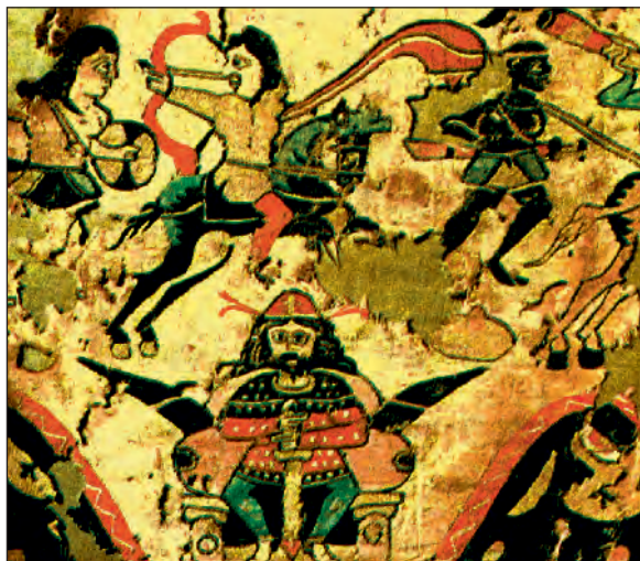
Πέρσης βασιλιάς παρακολουθεί διεξαγωγή μάχης. Παράσταση αιγυπτιακού τάπητα (Λυών, Ιστορικό Μουσείο Υφασμάτων).

Ενώ ο Ηράκλειος είχε εκστρατεύσει στην Ανατολή, οι Πέρσες σε αντιπερισπασμό πολίορκησαν την Κωνσταντινούπολη, σε συ-