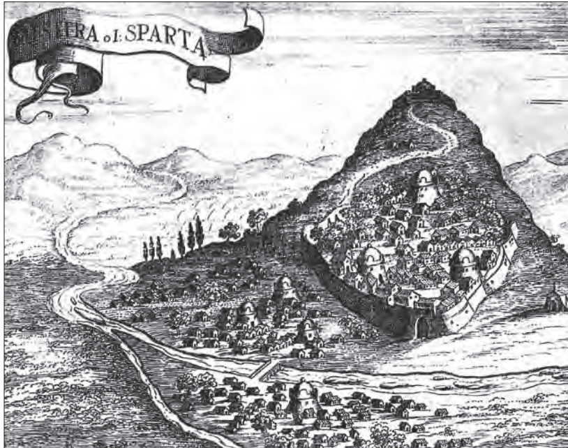
Οι οχυροί -φυσικά και τεχνητά - οικισμοί αποτελούν ένα από τα χαρακτηριστικά του Μεσαίωνα. Εδώ το κάστρο και η πόλη του Μυστρά που ιδρύθηκαν το 13ο αιώνα, 6 κλμ. δυτικά από τη Σπάρτη, στις πλαγιές του Σπαρτοβουνίου.