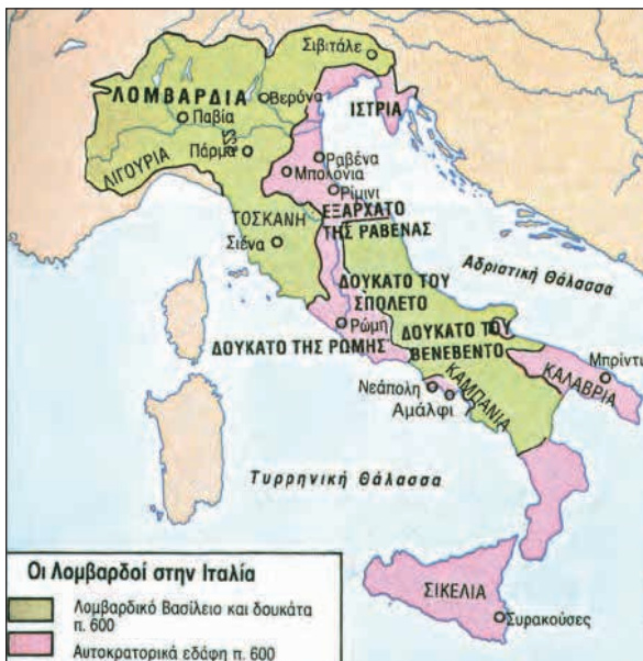
Η Βυζαντινή Ιταλία μετά τις πρώτες κατακτήσεις των Λογγοβάρδων (αρχές 7ου αι.)

Υπό την πίεση των Αβάρων οι Λογγοβάρδοι ή Λομβαρδοί μετανάστευσαν και κατέκτησαν εύκολα μεγάλο μέρος της Ιταλίας (568). Η απώλεια των ιταλικών εδαφών, που είχαν ανακτηθεί με τεράστιες θυσίες από τον Ιουστινιανό, ήταν ένα οδυνηρό πλήγμα για την αυτοκρατορία. Για να περισώσει τις υπόλοιπες ιταλικές και βορειοαφρικανικές κτήσεις του, ο Μαυρίκιος ίδρυσε τα εξαρχάτα* της