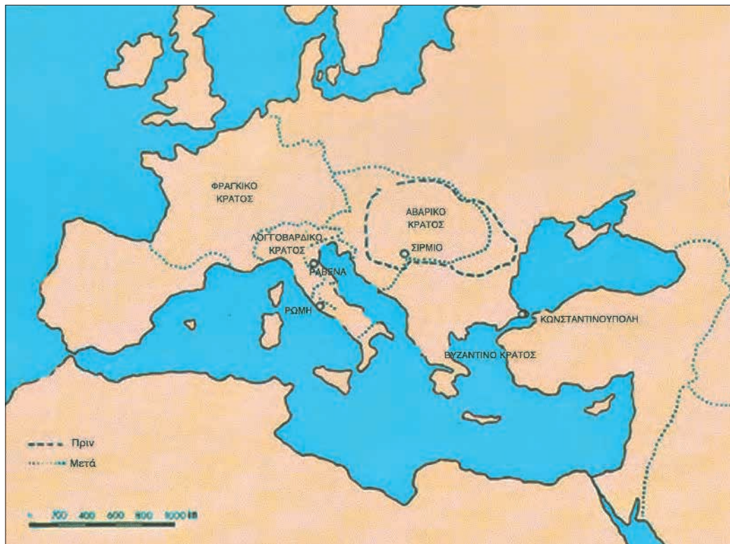
Η Ευρώπη περί το 570 μ.Χ.