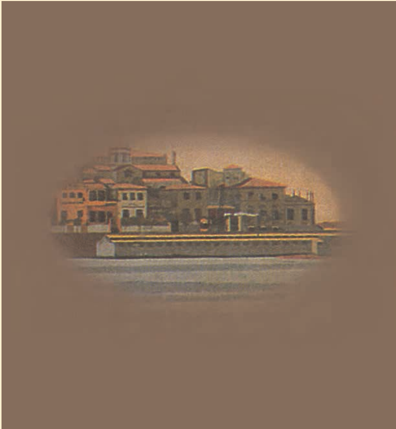
Γιάννης Τσαρούχης (1910-1989), Πειραιάς (λεπτομέρεια)