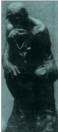
Ο “Στοχαστής” του Ροντέν

Προφανής συνέπεια της ευρύτητας αυτής εφαρμογής του όρου “φιλοσοφία” υπήρξε η σύγχυση που επικράτησε στον κοινό νοου για το αντικείμενό της, σύγχυση η οποία με τη σειρά της οδήγησε σε μια αίσθηση “δικαιώματος ελεύθερης χρήσης” του όρου. Αντί, για παράδειγμα, να παροτρύνουμε κάποιον να “σκεφτεί με ψυχραιμία και υπομονή” λέγοντας ακριβώς αυτές τις λέξεις, συνήθως λέμε “φιλοσόφησέ το” ή, σε άλλη περίπτωση, αντί να πει ο διευθυντής της επιχείρησης στους υπαλλήλους του “προς το παρόν δεν είμαστε σε θέση να κάνουμε αυξήσεις”, προτιμά να πει “η φιλοσοφία μας είναι