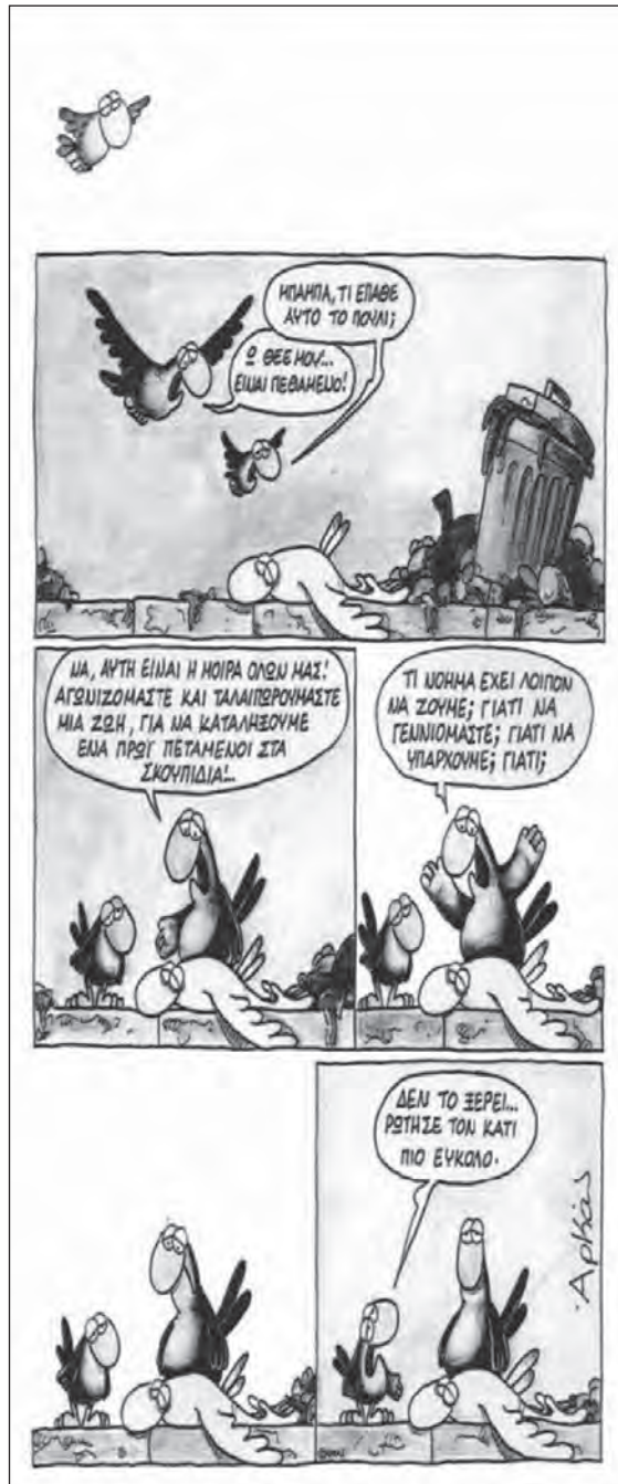
Γελοιογραφία Αρκάς, Χαμηλές πτήσεις, εκδ. γράμματα.

Μερικές φορές, όταν δεν είμαστε απορροφημένοι από τις καθημερινές μας ασχολίες και βρίσκουμε λίγο χρόνο να παρατηρήσουμε ήρεμα τα πράγματα γύρω μας και μέσα μας και να στοχαστούμε πάνω στη σημασία τους, συνειδητοποιούμε ότι θα 'πρεπε να μας απασχολήσει σοβαρά το ίδιο το γεγονός ότι υπάρχουμε και βρισκόμαστε μέσα στον κόσμο. Σε μια τέτοια περίπτωση αυτά που συνήθως θεωρούμε αυτονόητα, σχετικά με τον εαυτό μας, τους άλλους ανθρώπους και τα πράγματα, το ότι γεννηθήκαμε και μεγαλώσαμε, το ότι ο ήλιος ανατέλλει και δύει κάθε μέρα, το ότι οι λέξεις έχουν κάποιο νόημα, ξαφνικά μας προκαλούν έκπληξη και θαυμασμό (απορία). Αυτός ο θαυμασμός δείχνει πως έχουμε υιοθετήσει μια φιλοσοφική στάση. Τότε μας γεννιούνται παράξενα ερωτήματα, που θυμίζουν αυτά που κάποτε διατυπώνουν τα παιδιά: Ποιος είμαι στ' αλήθεια; Από πού έρχομαι και πού πηγαίνω; Γιατί υπάρχει ο κόσμος; Ποιος τον δημιούργησε; Τι είναι ο χώρος και τι ο χρόνος; Τι γίνεται όταν πεθαίνουν οι άνθρωποι; Τι είναι το καλό και τι το κακό; Είμαστε ελεύθεροι όταν προβαίνουμε σε συγκεκριμένες πράξεις ή μας καθορίζουν βαθύτερες δυνάμεις που δεν μπορούμε να ελέγξουμε; Τι κάνει τα ωραία πράγματα ωραία;