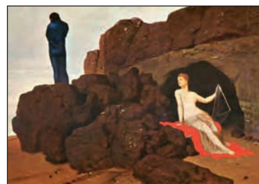
Άρνολντ Μπαϊκλιν, Οδυσσέας και Καλυψώ , 1882, Βασιλεία, Μουσείο Καλών Τεχνών

Στην αρχή νομίζουμε ότι τα ερωτήματα που μας αναγκάζουν να ξεκινήσουμε μια φιλοσοφική συζήτηση είναι δύσκολα αλλά συνηθισμένα, σαν εκείνα που αντιμετωπίζει η επιστήμη. Όταν όμως προσπαθήσουμε να τα απαντήσουμε, συνειδη- τοποιούμε την ιδιαιτερότητά τους. Δεν ξέρουμε από πού να ξεκινήσουμε την ανάλυσή τους και ποια μέθοδο πρέπει να χρησιμοποιήσουμε, για να βρούμε την απάντηση στο πρόβλημα που διατυ-