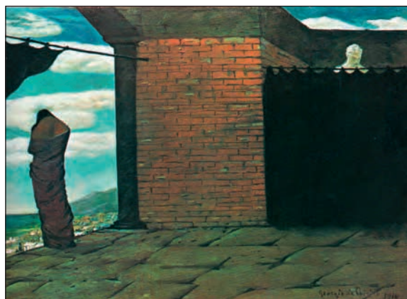
Τζιόρτζιο Ντε Κίρικο, Το αίνιγμα του χρησμού , 1910, Ιδι- ωτική συλλογή. Η μορφή που έχει στραμμένη την πλάτη της στον θεατή και βρίσκεται σε περισυλλογή -αποτελεί πιστή αντιγραφή από το έργο του Μπαϊκλιν Οδυσσέας και Καλυψώ - αντιπροσωπεύει τον καλλιτέχνη-φιλόσο- φο, που στέκεται σκεπτικός μπροστά στα μυστήρια του κόσμου. Δεξιά, ο μάντης πίσω από το παραπέτασμα πα- ραπέμπει στην αινιγματική, κρυφή όψη της ύπαρξης.

πώνουν. Μάλιστα, για να δώσουμε κάποια ικανο- ποιητική απάντηση σε πολλά από αυτά τα ερωτή- ματα, φαίνεται πως θα χρειαζόταν να κοιτάξουμε νοερά τους εαυτούς μας και τον κόσμο “απέξω”, κάτι μάλλον ακατόρθωτο. Ωστόσο, τα φιλοσοφι- κά ερωτήματα και τα προβλήματα που αυτά θέ- τουν φαίνεται να ασκούν πάνω μας μια παράξενη γοητεία, να μας προξενούν δέος και αμηχανία ή μπορεί και να μας εκνευρίζουν όταν οδηγούμαστε