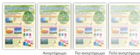
Σημείωση: Η μείωση γραφίτη διαφέρει ανάλογα με τα δεδομένα που εκτυπώνονται. Τα αποτελέσματα ενδέχεται επίσης να διαφέρουν.

Η λειτουργία εξοικονόμησης γραφίτη έχει τρεις ρυθμίσεις που σας επιτρέπουν να διαχειρίζεστε τη χρήση γραφίτη επιλέγοντας τη ρύθμιση που ταιριάζει καλύτερα στις ανάγκες σας. Για παράδειγμα, για εσωτερικά έγγραφα που ενδεχομένως δεν χρειάζονται υψηλή ποιότητα εκτύπωσης, επιλέξτε απλά 'ανοιχτόχρωμο' ή 'πολύ ανοιχτόχρωμο' για εξοικονόμηση γραφίτη.